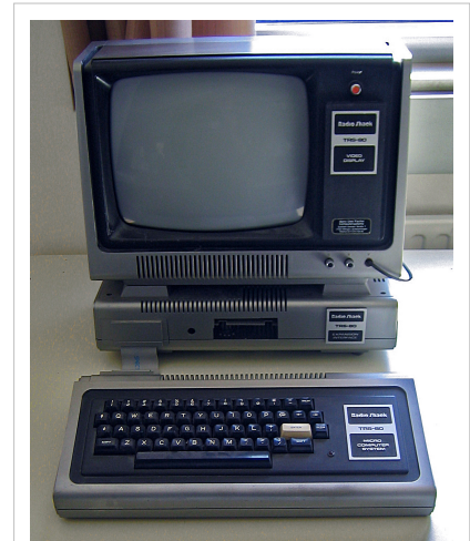
Noviembre de 1977: TRS-80 Modelo I

El Modelo I usó un procesador Zilog Z80 con un reloj de 1,77 MHz (los modelos posteriores fueron despachados con un procesador Z80A). El modelo básico originalmente se despachaba con 4 KB de RAM, y más tarde con 16 KB. Sus otras características fuertes eran su teclado QWERTY completo, tamaño pequeño, bien escrito BASIC de punto flotante e inclusión de un monitor y de un grabador de cassettes todo por $599 dólares, un ahorro de $600 sobre el Apple II.